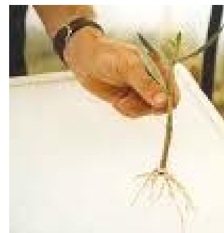
Piante autoradicate (per alcune specie)