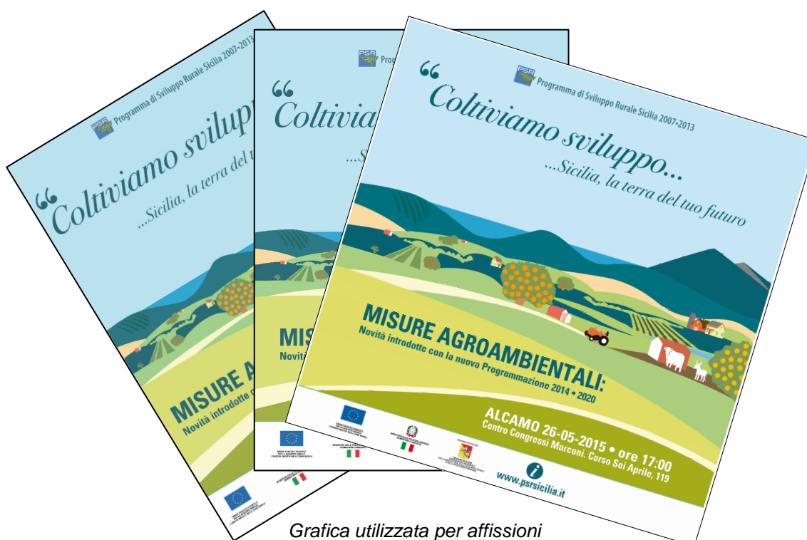
Grafica utilizzata per affissioni

È stata, altresì, realizzata una campagna di affissione statica che ha previsto l'utilizzo di impianti su manufatti di arredo urbano 100X140 e impianti speciali 600x300 per informare e promuovere i seminari presso i comuni di riferimento.