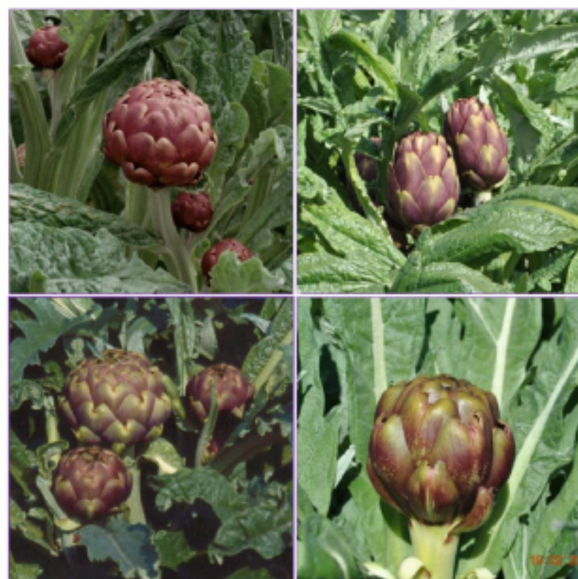
Alcune delle varietà coltivate presso le aziende partner